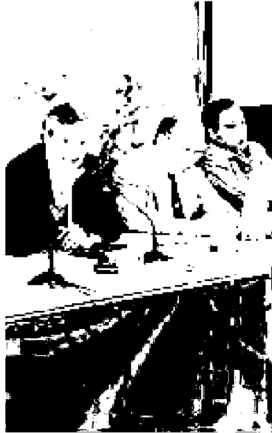
ORIENTE Un momento dell'incontro

Secondo Hoang Long Nguyen, vicedirettore per l'Europa del ministero degli Affari esteri del Vietnam, abbiamo molte cose in comune. "Esportiamo prodotti in tutto il mondo, compresa l'Italia da cui possiamo importare tecnologia all'avanguardia. Guardiamo con interesse al know how ed alla rete delle Pmi italiane come modello che può contribuire allo sviluppo in termini di assistenza tecnica alle piccole e medie imprese vietnamite". Per tipologia di attività e produzioni, le imprese emiliano-romagnole sono al secondo posto tra le più interessate al mercato vietnamita, appena dopo quelle lombarde nei settori della meccanica, arredamento ed elettrodomestici, abbigliamento. L'esigenza di potenziamento delle infrastrutture in Vietnam apre frontiere per le imprese di costruzioni, mezzi di trasporto e apparecchiature per energia.