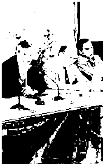
ORIENTE Un momento dell'incontro

Secondo Hoang Long Nguyen, vicedirettore per l'Europa del ministero degli Affari esteri del Vietnam, abbiamo molte cose in comune. "Esportiamo prodotti in tutto il mondo, compresa l'Italia da cui possiamo importare tecnologia all'avanguardia. Guardiamo con interesse al know how ed alla rete delle Pmi italiane come modello che può contribuire allo sviluppo in termini di assistenza tecnica alle piccole e medie imprese vietnamite". Per tipologia di attività e produzioni, le imprese emiliano-romagnole sono al secondo posto tra le più interessate al mercato vietnamita, appena dopo quelle lombarde nei settori della meccanica, arredamento ed elettrodomestici, abbigliamento. L'esigenza di potenziamento delle infrastrutture in Vietnam apre frontiere per le imprese di costruzioni, mezzi di trasporto e apparecchiature per energia.