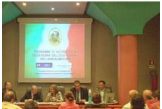
Presentazione nella Camera di Commercio di Campobasso