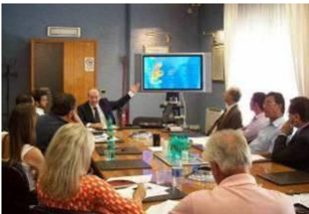
Presentazione nella Camera di Commercio di Foggia