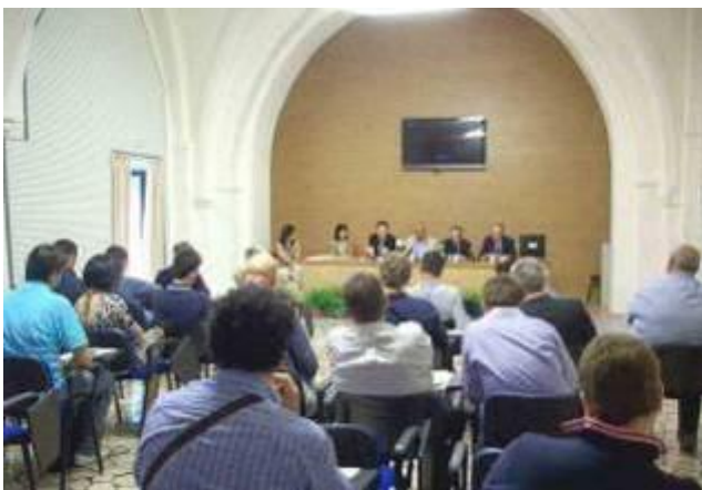
Presentazione nel Comune di Andria (BAT)

El programma continuerà durante quest'anno e il prossimo, con missioni commerciali e imprenditoriali, incontri, workshops e forum tecnologici in Italia e in Argentina (a cominciare dalla prevista missione del sistema camerale italiano in Argentina, a responsabilità Unioncamere/Promos del 23-26 novembre con destinazione Buenos Aires).