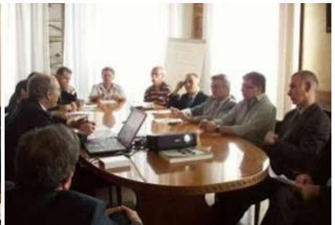
Presentazione nella Camera di Commercio di Reggio Calabria