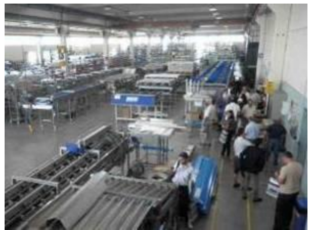
Visita a stabilimenti con tecnologia di avanguardia

Organizzata congiuntamente con la Fondazione ProMendoza, imprenditori di Mendoza del settore della frutta, hanno realizzato una missione tecnico-impreditoriale nelle Regioni produttrici dell'Italia. Il gruppo di impresari hanno visitato vivai, coltivazioni, stabilimenti di elaborazione e metalmeccaniche d'appoggio al settore. Con professori e ricercatori dell'Università di Bologna hanno analizzato le tecniche innovative di produzione e conservazione da poter essere utilizzate nelle loro aziende argentine.