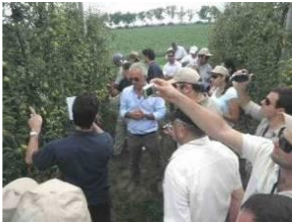
Visita di coltivazioni di pero in Emilia Romagna