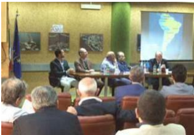
Presentazione nella Camera di Commercio di Brindisi