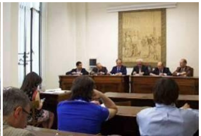
Presentazione nella Camera di Commercio di Bari